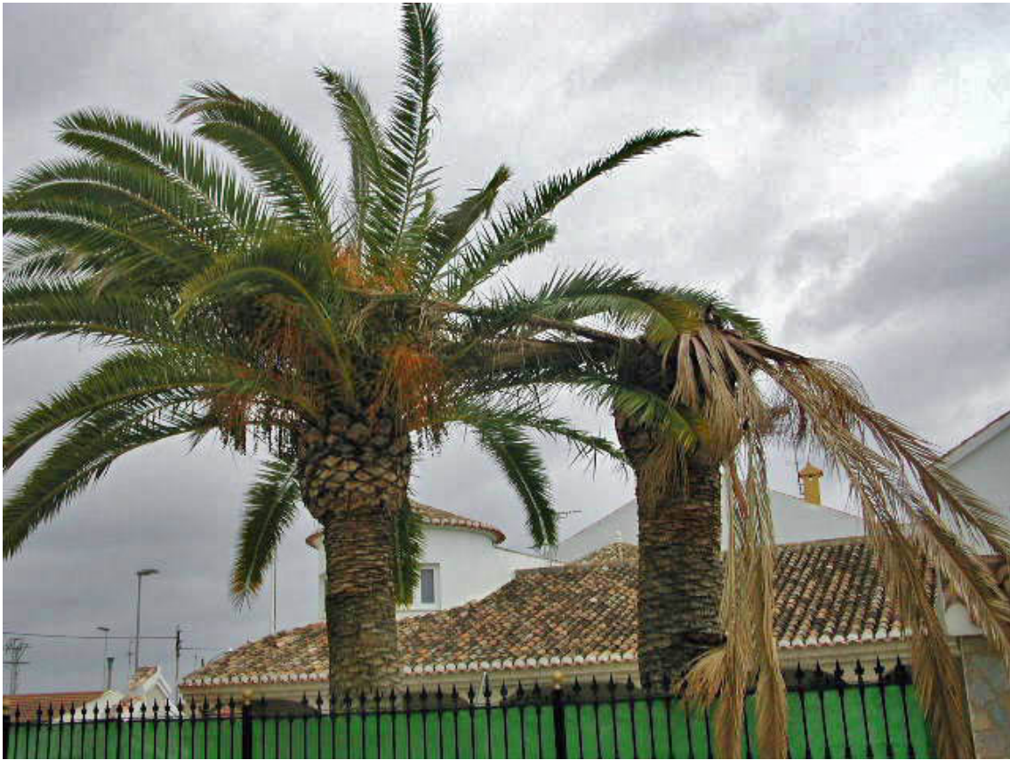
Daños en hojas de palmera afectada