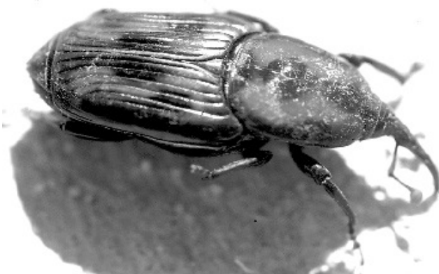
Ejemplar del escarabajo rynchophorus ferrugineus , más conocido como picudo rojo