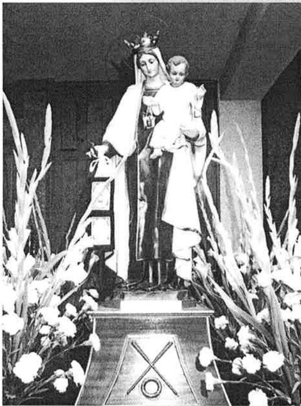
Virgen del Carmen